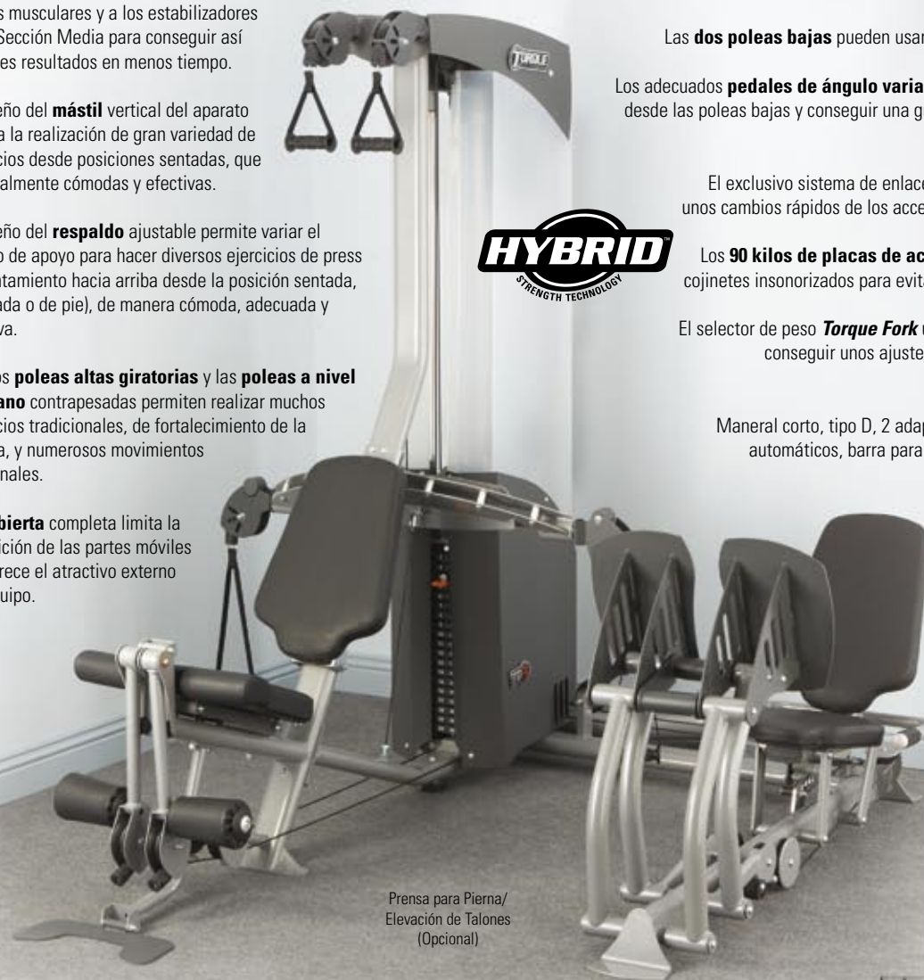
Prensa para Pierna/ Elevación de Talones (Opcional)

La tecnología especial Iso-Balance permite hacer Prensa para piernas con plataforma conectada a los dos pies o trabajando con uno solo para añadir variedad al ejercicio y un entrenamiento equilibrado.